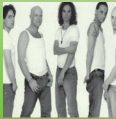
Brings 03.10.2009 Jabachhalle