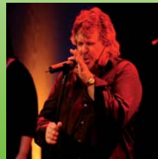
Tommy Engel 31.10.2009 Jabachhalle